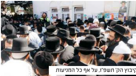
הקיבוץ הק' תשפ"ו, על אף כל המניעות