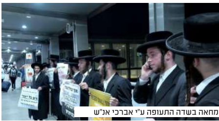
המחאה בשדה התעופה ע"י אברכי א"ש

ללי העולמי הקדוש זמן מיוחד להתפלל עבור צרת וגזירת הגיוס והשבויים ברוחניות ובגשמיות... ובודאי שום תפילה אינה נאבדת והכל מצטרף לחשבון גדול. כי העצורים אינם לבד כולנו לצי- דם ומאחוריהם והתפילות החמות מעידות על כך כמה עדים ובודאי פעלו התפילות את פעולתם.