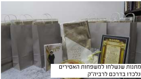
המתנות שנשלחו למשפחות האסירים שנלכדו בדרכם לרביה"ק