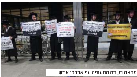
המחאה בשדה התעופה ע"י אברכי א"ש