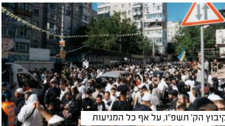
הקיבוץ הק' תשפ"ו, על אף כל המניעות