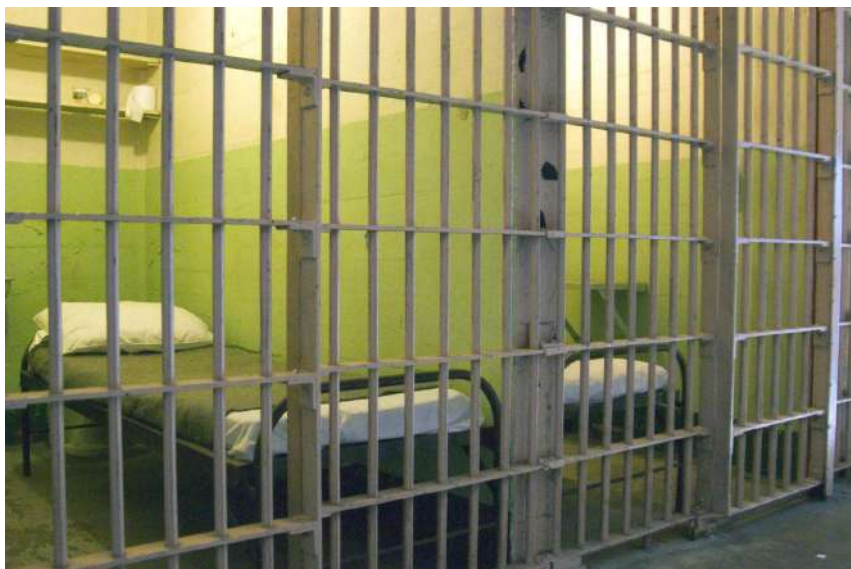
כלא 10, החדרים