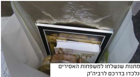
המתנות שנשלחו למשפחות האסירים שנלכדו בדרכם לרביה"ק